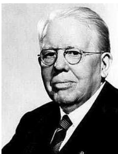
Melvin Jones (* 1879 / + 1961)

Encerramos este trabalho com uma das mais lindas frases deste Ser Iluminado: